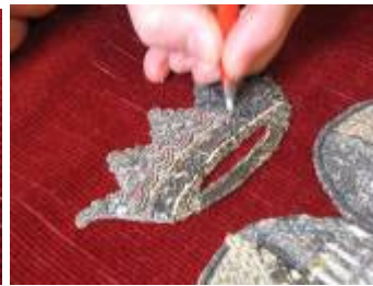
Sølvtrådene renses let med glashårspensel