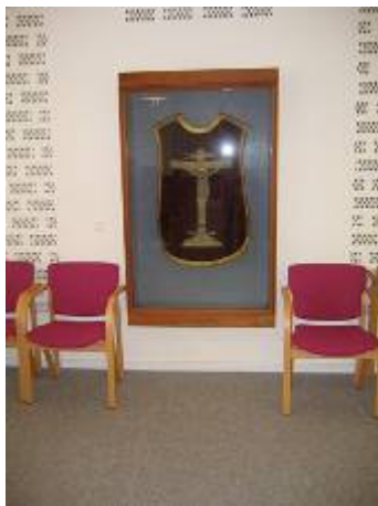
Messehagel i Sønderholm Kirke

Dette lille guldbroderi, som måler ca. 14,5 x 17,5 cm, er broderet på et særskilt stykke stof for at kunne genanvendes, når messehagelen blev slidt og stoffet skulle udskiftes. Det er også derfor, broderiet stadig er bevaret. Der er anvendt flere forskellige teknikker: fladsynings-teknik udført over karton og flere forskellige typer nedlagt syning. Broderiteknikken er typisk for 1700 årene og svarer til dateringen fra år 1756.