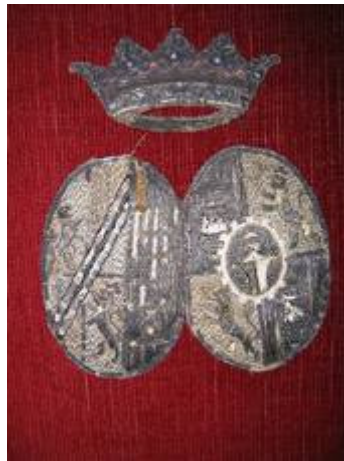
Før restaurering. Hul øverst i venstre skjold. Løse tråde