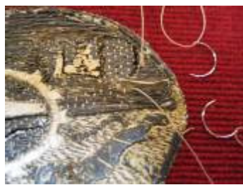
Trådene lægges ned med tråd og krumnål